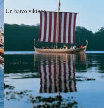
Un barco vikingo