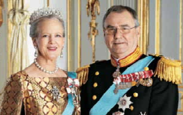
Su Majestad la reina Margrethe y Su Alteza Real el príncipe Henrik.