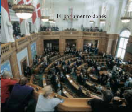
El parlamento danés