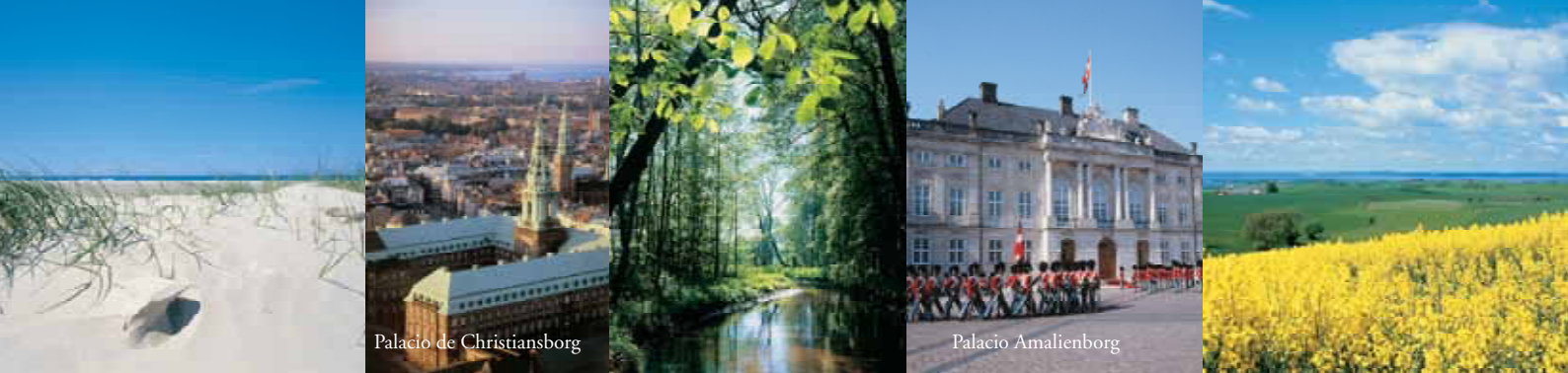
Palacio de Christiansborg