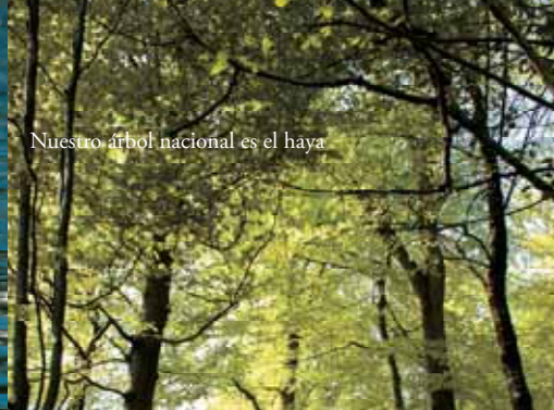
Nuestro árbol nacional es el haya