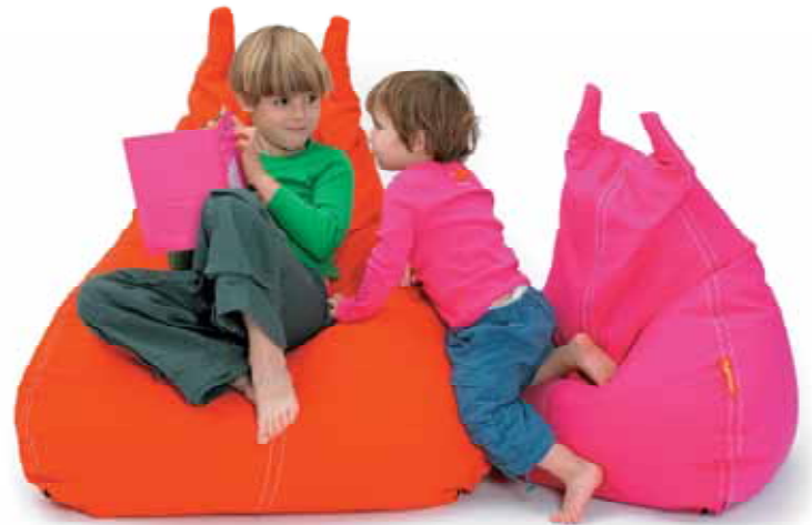
La silla "Gato Gordo"

Nuestros diseñadores de muebles también están entre los mejores del mundo. Y también diseñan muebles para niños.