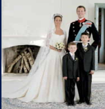
Su alteza el príncipe Joachim, princesa Marie y los dos hijos del príncipe Joachim de su primer matrimonio.