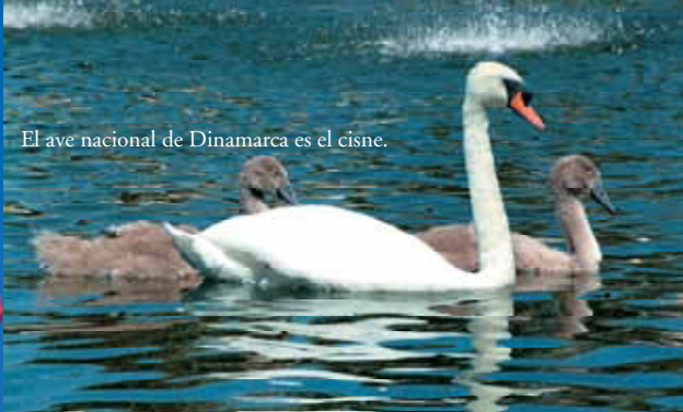
El ave nacional de Dinamarca es el cisne.