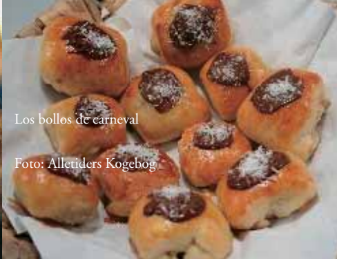
Los bollos de carnaval