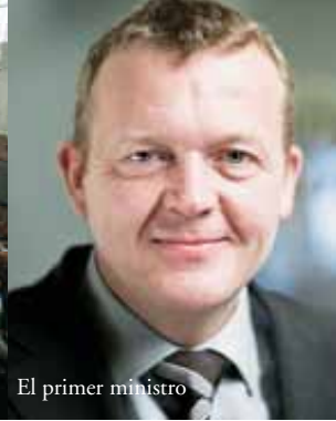
El primer ministro